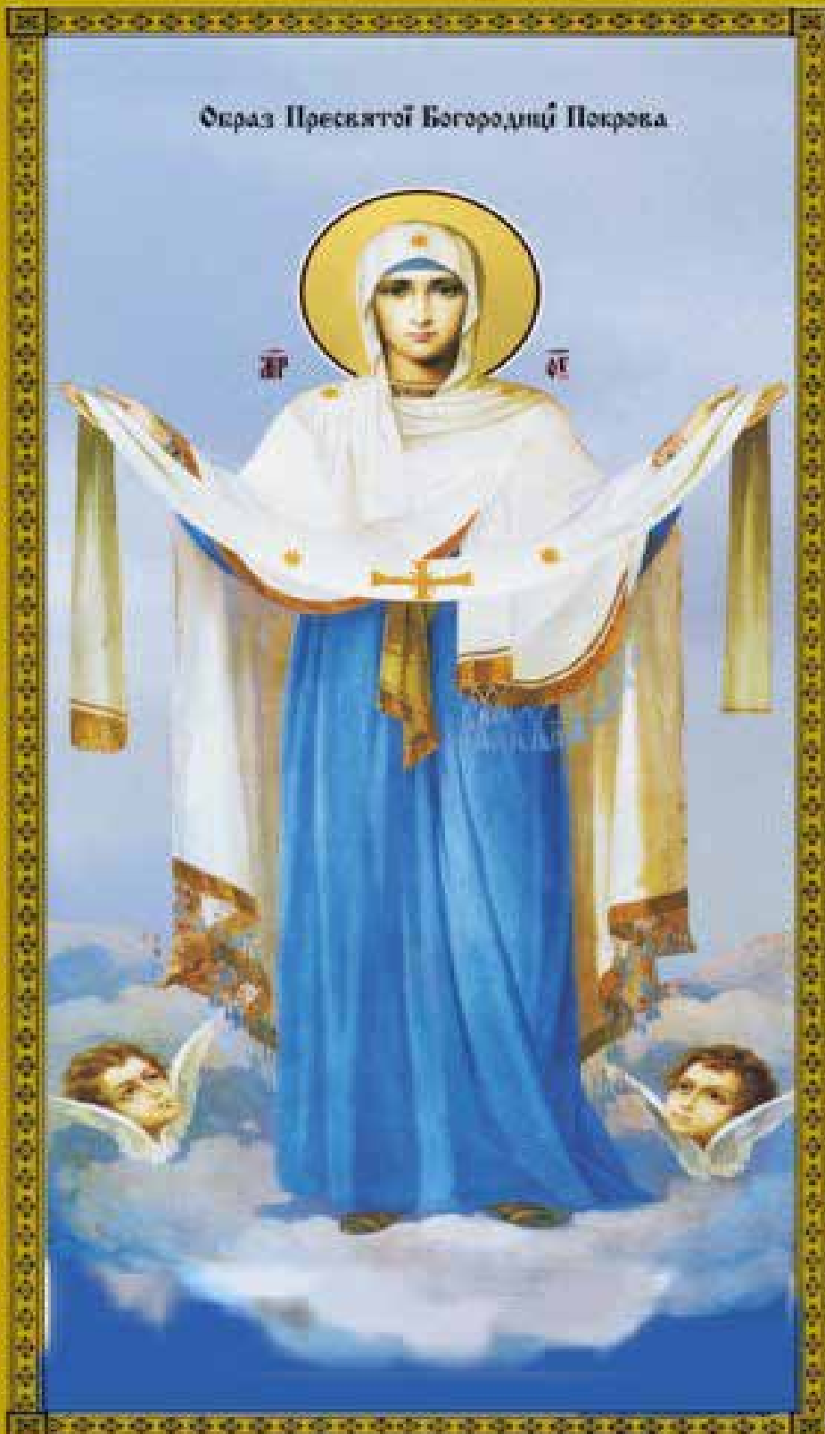
Образ Пресвятої Богородиці Покрова